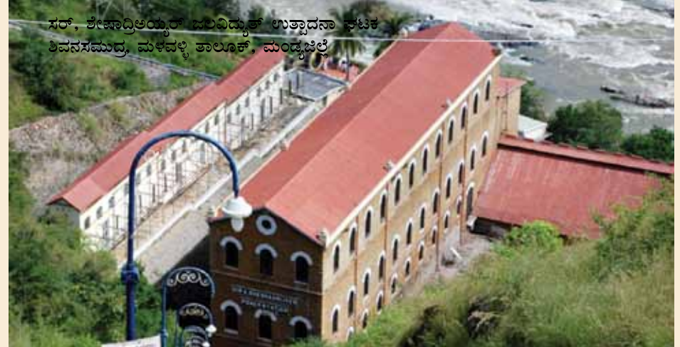
ಸರ್, ಶೇಷಾದ್ರಿ ಅಯ್ಯರ್ ಜಲವಿದ್ಯುತ್ ಉತ್ಪಾದನಾ ಸಚಿವ ಶಿವನಸಮುದ್ರ, ಮಳವಳ್ಳಿ ತಾಲೂಕ್, ಮಂಡ್ಯಜಿಲ್ಲೆ

ಕ್ರಿ.ಶ.೧೮೮೬ರಲ್ಲಿ, ಶೇಷಾದ್ರಿ ಅಯ್ಯರ್‌ರವರು ಕೋಲಾರ ಪ್ರದೇಶದಲ್ಲಿ (ಕೋಲಾರ್ ಗೋಲ್ಡ್