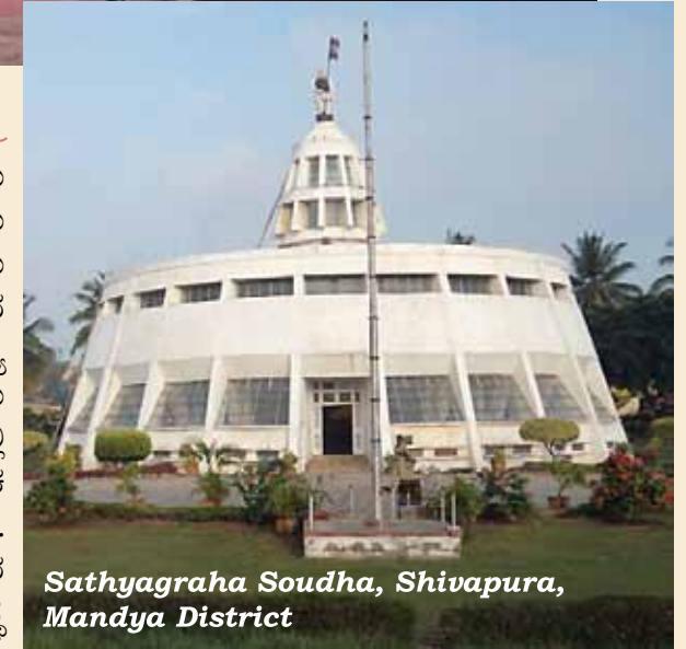
Sathyagraha Soudha, Shivapura, Mandya District

೧೯೩೭ರವರೆಗೆ ಮೈಸೂರು ರಾಜ್ಯದಲ್ಲಿ ಯಾವುದೇ ಪ್ರತಿಭಟನೆಗಳು ಇಲ್ಲದಿದ್ದರೂ, ಆ ವರ್ಷದಲ್ಲಿ ಮೈಸೂರು ರಾಜ್ಯದ ಜನರು ಮೈಸೂರು ಕಾಂಗ್ರೆಸ್‌ನ ಸ್ಥಾಪನೆ ಮಾಡಿ ಶಿವಪುರದಲ್ಲಿ (ಮಂಡ್ಯ ಜಿಲ್ಲೆ) ಮೈಸೂರು ಕಾಂಗ್ರೆಸ್‌ನ ಪ್ರಥಮ ಅಧಿವೇಶನವನ್ನು ಏಪ್ರಿಲ್ ೧೯೩೮ರಲ್ಲಿ ಆಯೋಜಿಸುವುದರೊಂದಿಗೆ ಮೂಲಕ ಧ್ವಜಸತ್ಯಾಗ್ರಹವನ್ನು ಪ್ರಾರಂಭಿಸಲಾಯಿತು. ಇದಾದ ಸ್ವಲ್ಪವೇ ಅವಧಿಯ ನಂತರ ಏಪ್ರಿಲ್ ೨೫, ೧೯೩೮ರಲ್ಲಿ, ವಿದುರಾಶ್ವತ್ಥ (ಕೋಲಾರ ಜಿಲ್ಲೆ) ಅನಾಹುತವು ಜರುಗಿ, ಅದರಲ್ಲಿ ಪೊಲೀಸ್ ಗುಂಡಿನೇಟಿನಿಂದ ೧೦ ಸತ್ಯಾಗ್ರಹಿಗಳು ಮರಣ ಹೊಂದಿದರು. ಇದಾದ ನಂತರ, ೧೯೩೯ರಲ್ಲಿ ಅರಣ್ಯ ಸತ್ಯಾಗ್ರಹವು ಪ್ರಾರಂಭವಾಯಿತು, ಈ ಮೂಲಕ ರಾಜಾಡಳಿತ